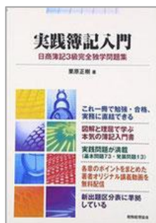
実践簿記入門 税務経理協会