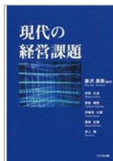
現代の経営課題 八千代出版株式会社